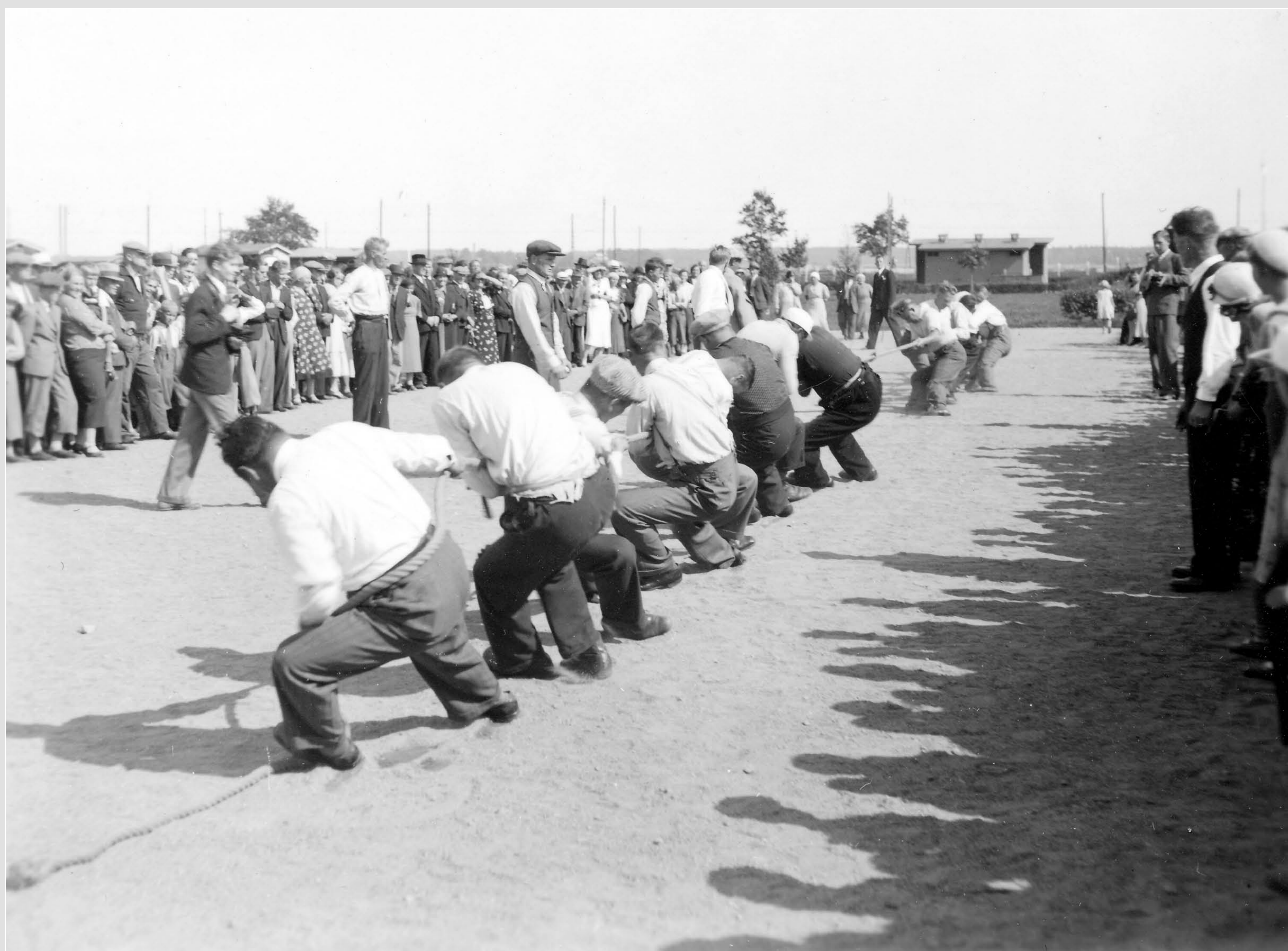
Köydenvetoa Vallilan siirtolapuutarhassa vuonna 1936.