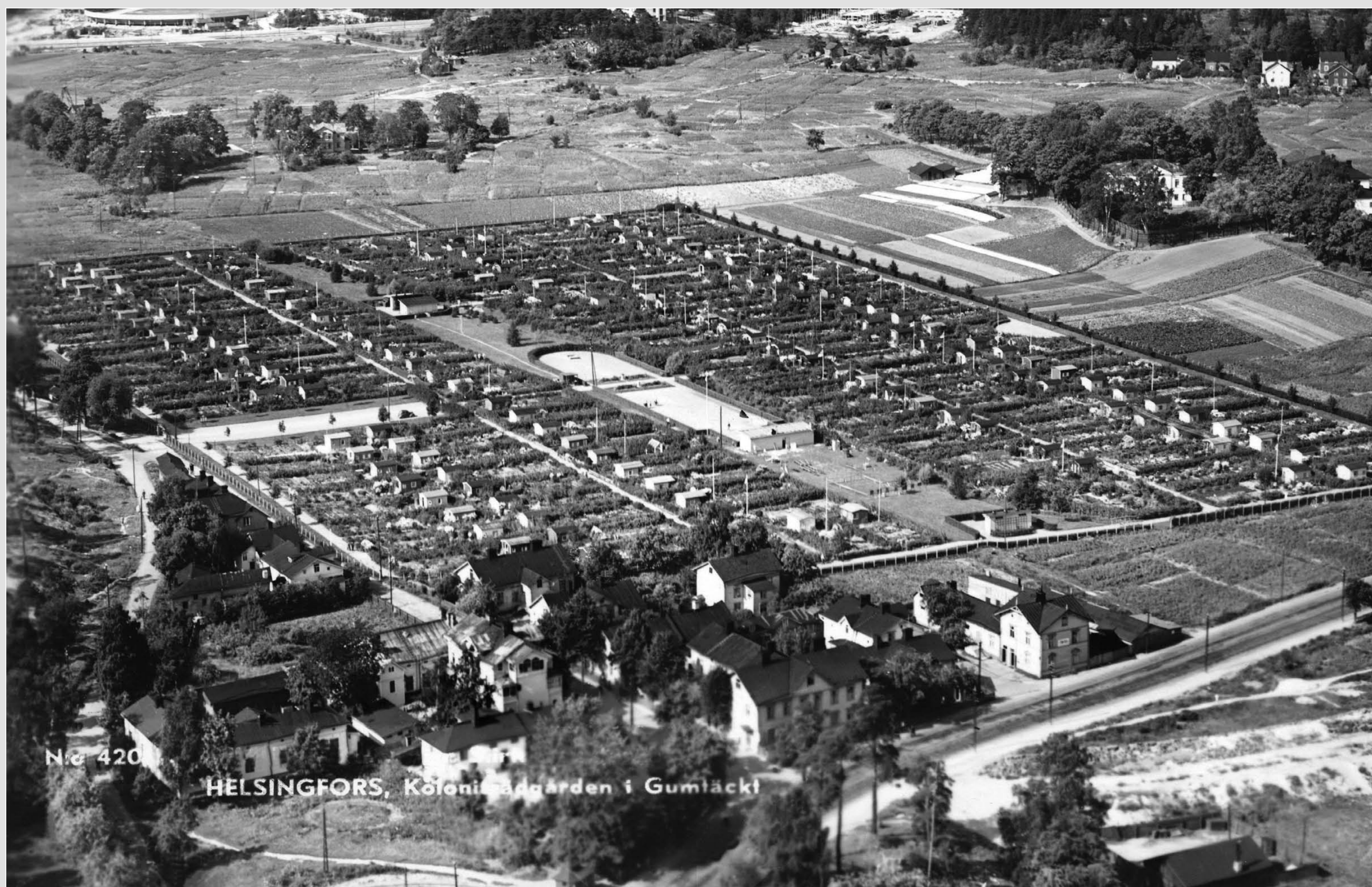
Viistokuva Vallilan siirtolapuutarhasta. Kuvaus aika todennäköisesti vuosi 1937. Siirtolapuutarhan leikkikentät näkyvät ilmakuvassa selvästi, samoin aukioita rajaavat pensasaidat. Kuvassa näkyy myös kioskiki keskikäytävän varrella kentän vieressä. Vuonna 1937 valmistui kuvassa näkyvä paviljonkirakennus.