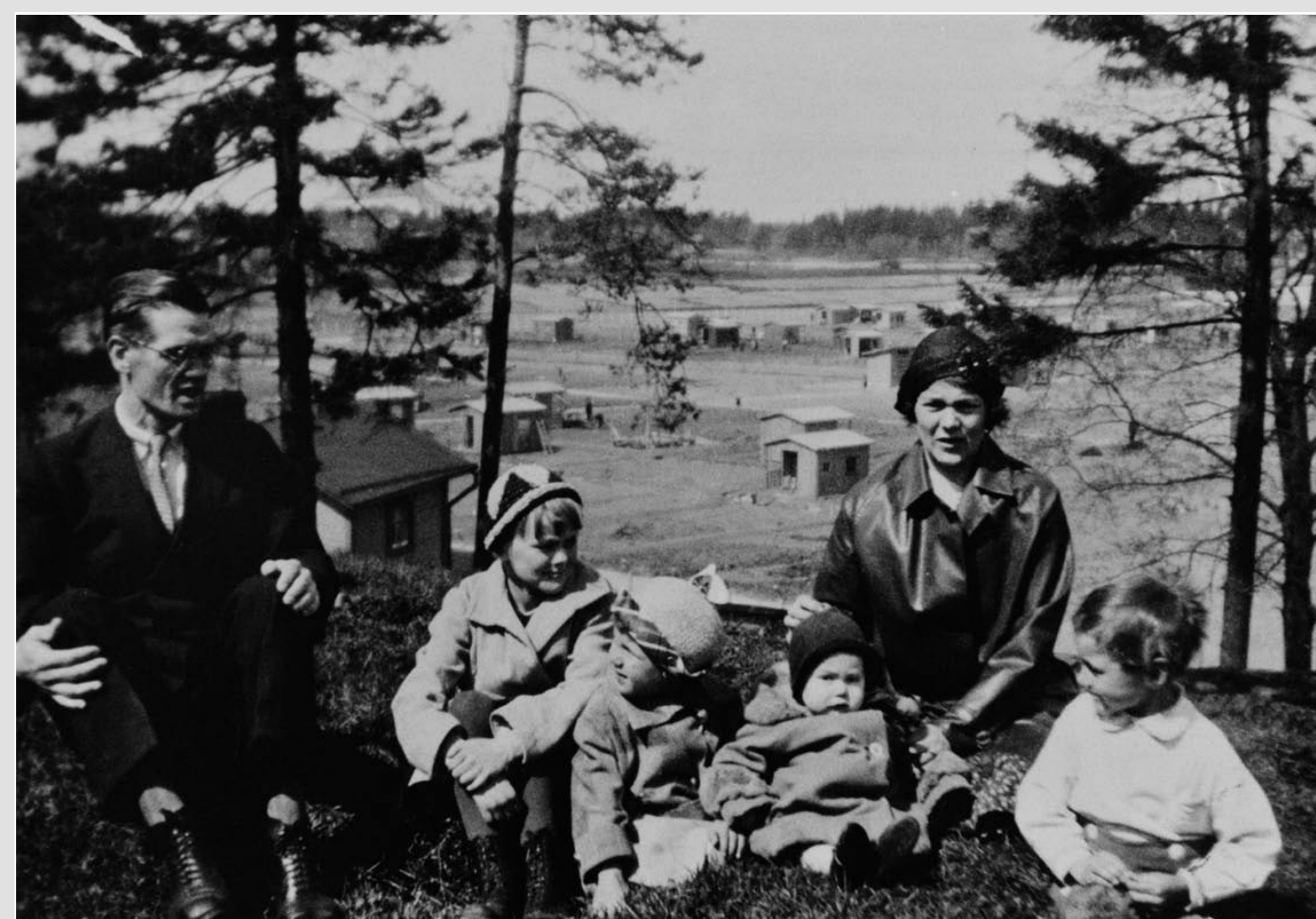
Kaupungin rajamailla sijaitseva Vallilan laakso ympäröivine metsärinteineen oli 1930-luvulla varmaankin suosittu retkikohde. Taustalla näkyy Vallilan siirtolapuutarha. Kuvausaika 1932 - 1933.