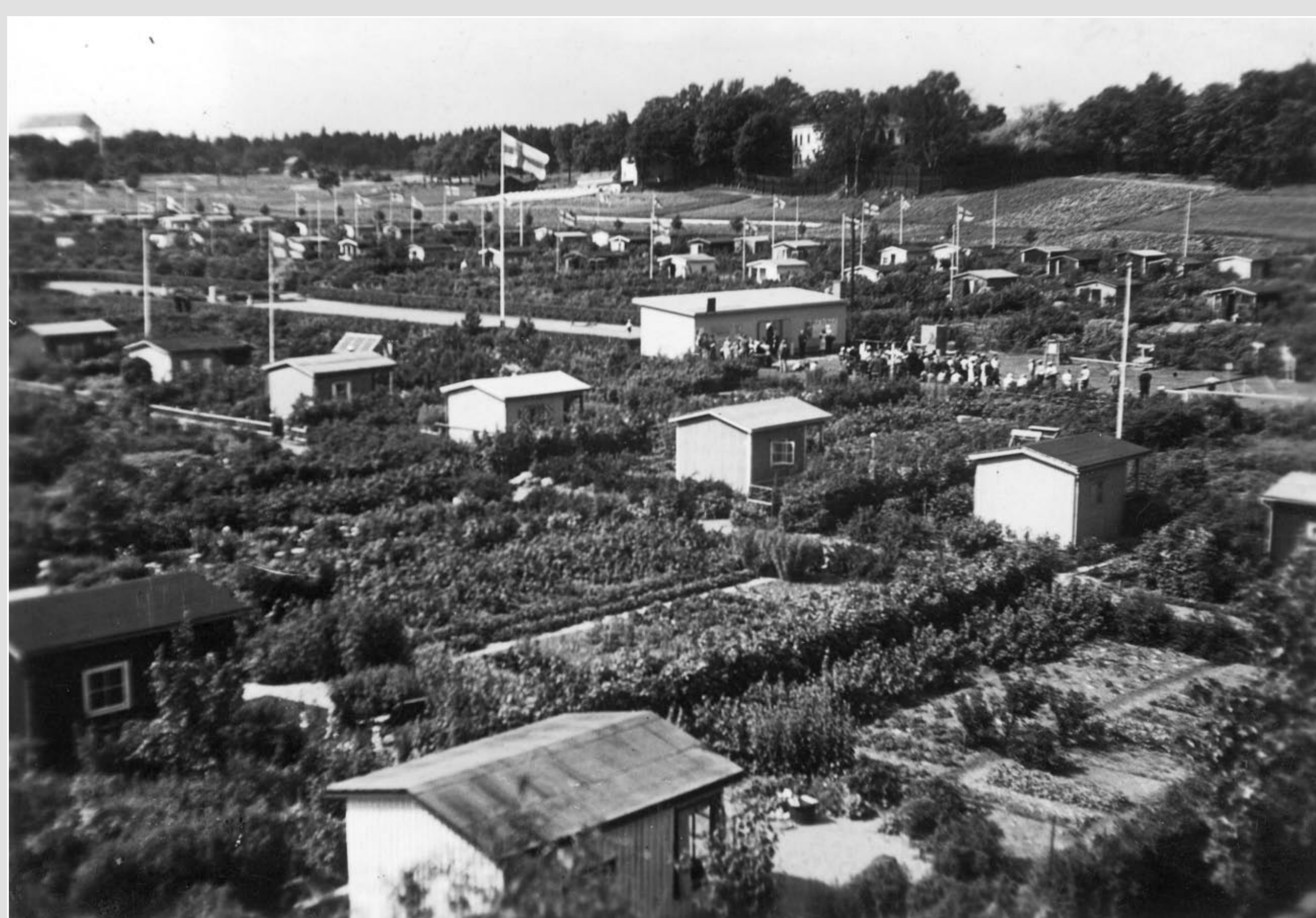
Vallilan siirtolapuutarhaa 1930-luvun lopulla. Kuvan keskellä näkyy uusi paviljonkirakennus.