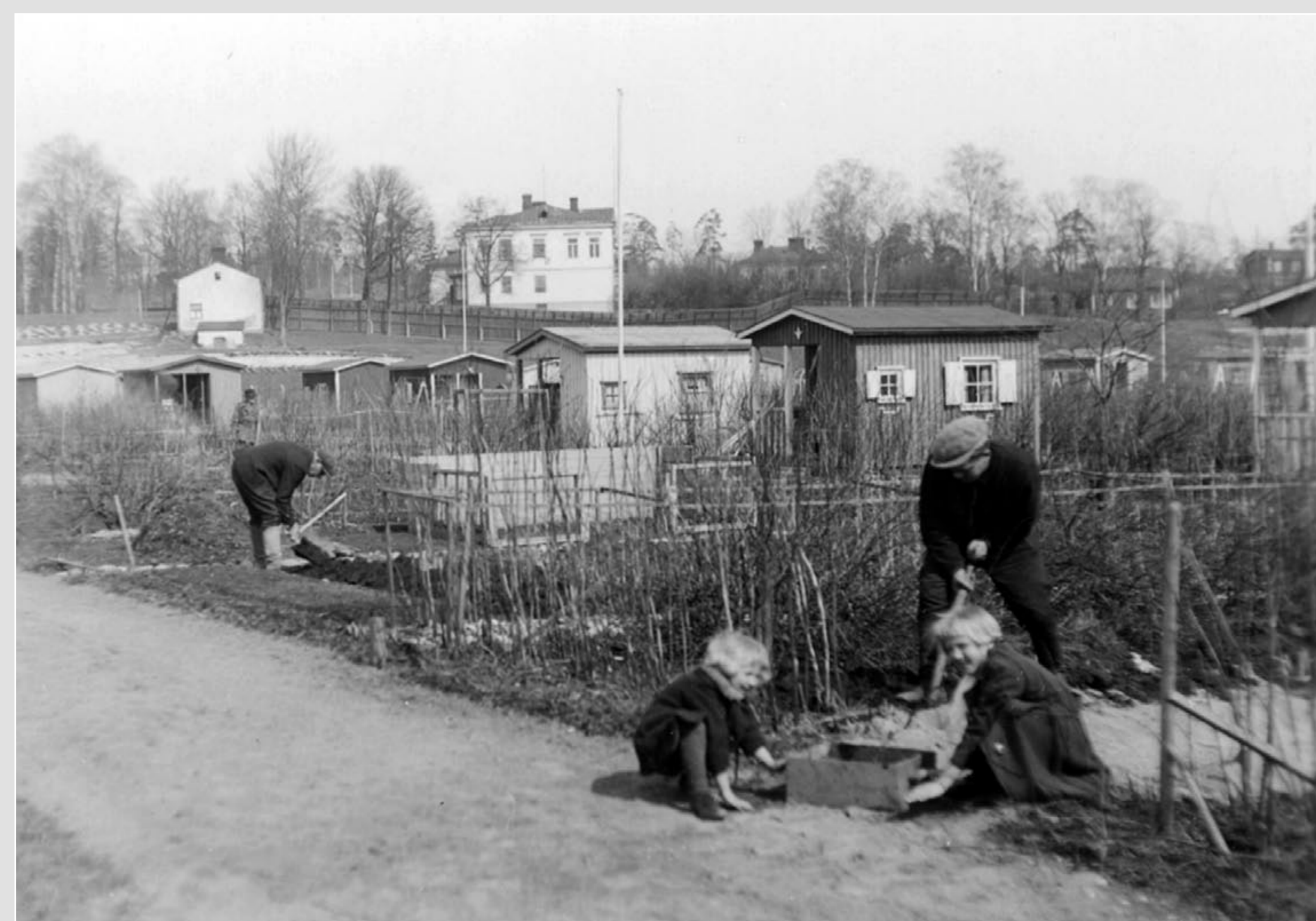
Istutustöitä Päärynäpolulla 1930-luvulla.