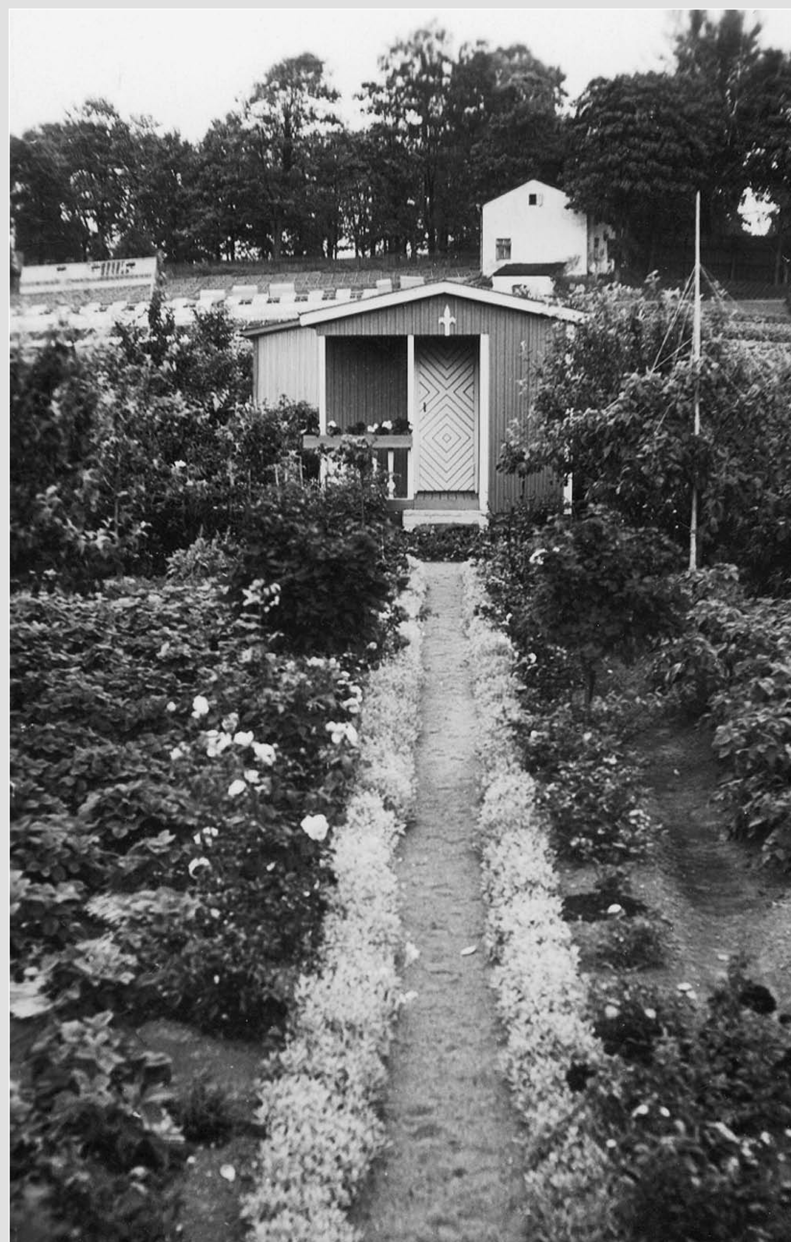
Suoraa sorapintaista käytävää rajaavat koristeistutukset: hopeahärkki ja pionit. Vasemmalla on mansikkamaa ja oikealla kasvaa perunaa.