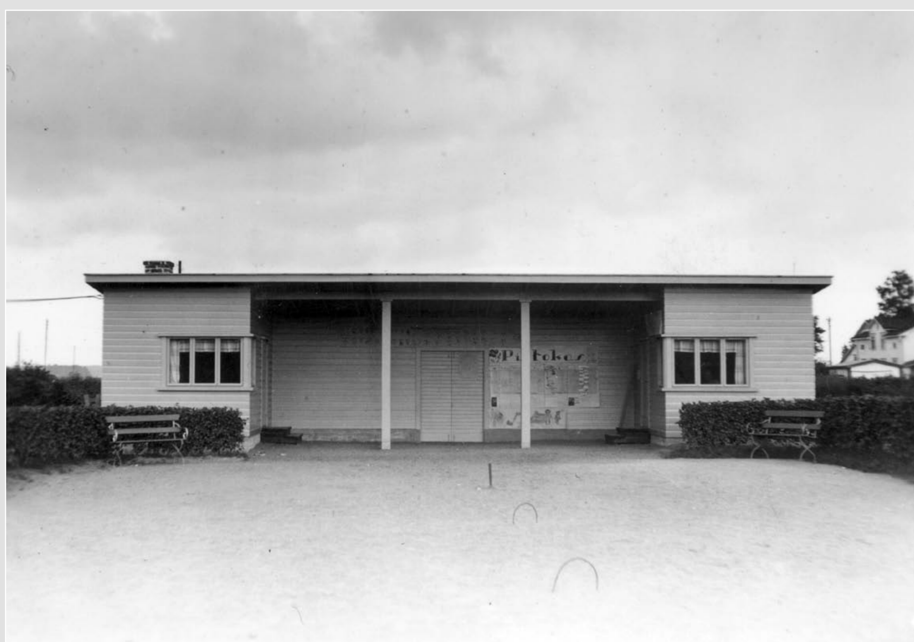
Vuonna 1937 valmistunut paviljonkirakennus.