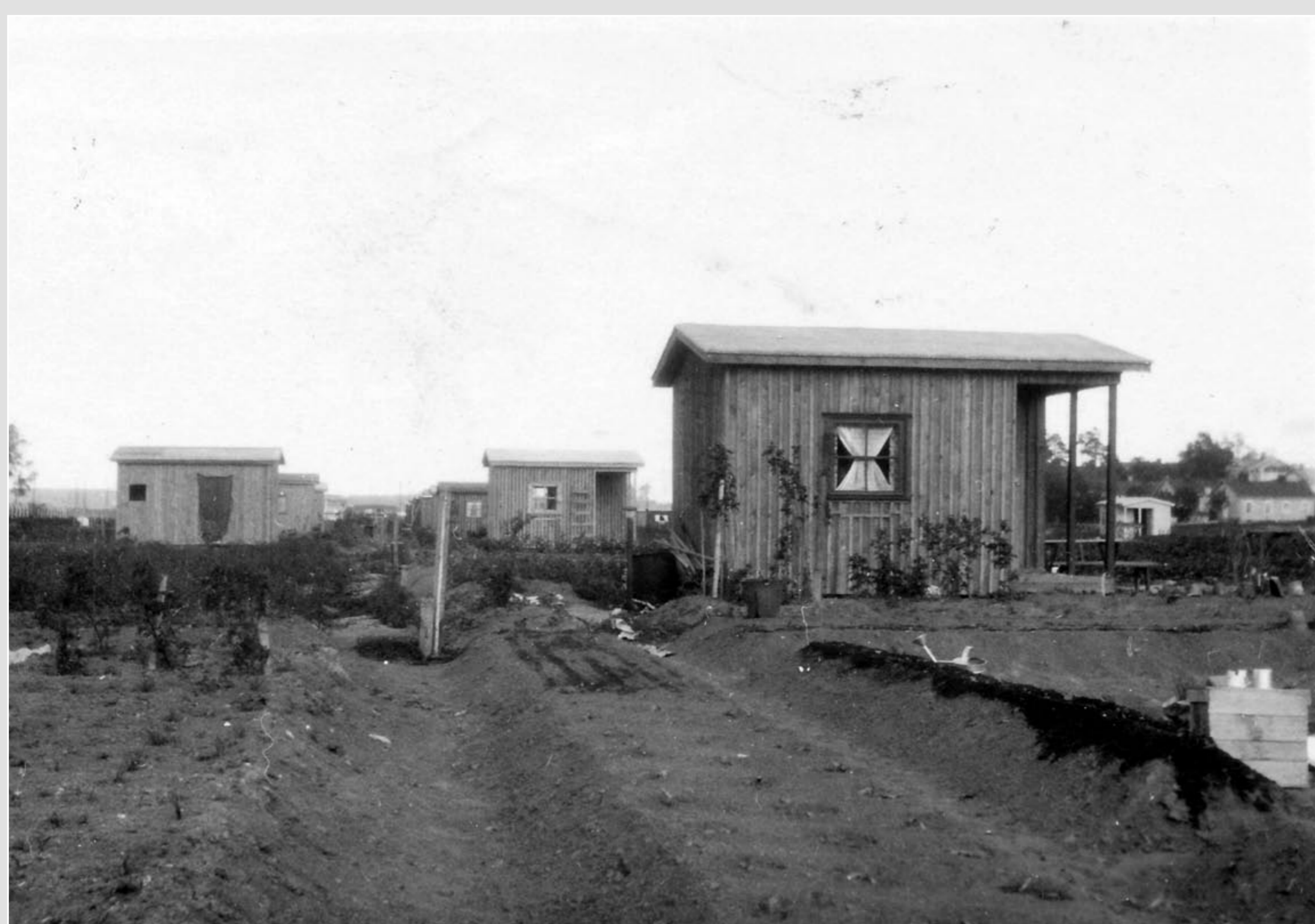
Keväisiä palstoja 1930-luvun alussa.